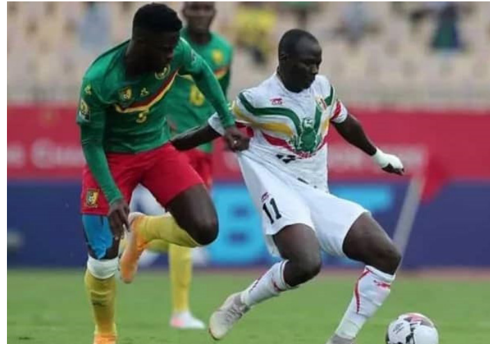
Camerounais et Maliens au coude à coude après une victoire et un nul de chaque côté.

au fond des filets d'une tête décroisée (1-0, 6e). Mais les Aigles ont très vite riposté sur une