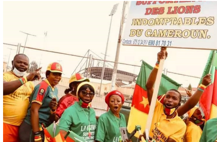
Les supporters camerounais heureux de retrouver le foot et les Lions Indomptables.

aux abords du stade Ahmadou-Ahidjo de Yaoundé. À une heure du coup d'envoi, il espérait encore trouver le fameux sésame pour voir les Indomptables. « J'ai